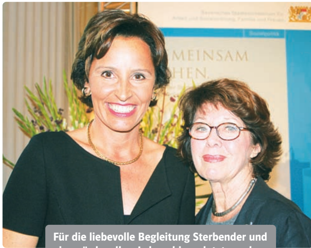
Für die liebevolle Begleitung Sterbender und ein würdevolles Leben bis zuletzt werben Sozialministerin Christine Haderthauer (links) und die Medizinerin Marianne Koch.

Es ist ein großes Geschenk, einfühlsam begleitet sterben zu dürfen“, so die Ministerin. Als Mitglied des Freundeskreises der Stiftung führte die Ärztin und Medizin-Autorin Marianne Koch durch den Abend. In Bayern gibt es heute rund 130 Hospizvereine, zwölf stationäre Hospize mit rund 120 Plätzen und ein stationäres Kinderhospiz. Deren Vertreter und viele Freunde der Stiftung waren als Gäste zum Jubiläum geladen. Unter ihnen der ehemalige Landtagspräsident Alois Glück sowie die Schauspielerin Ilona Grübel.